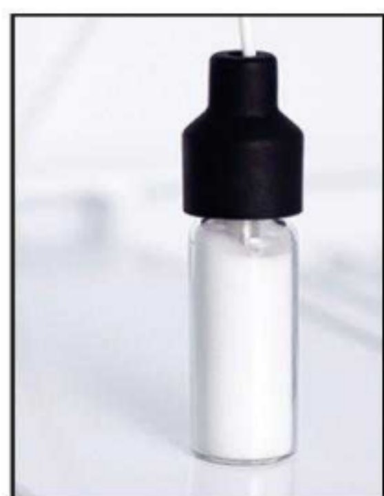
La sonde tampon affiche une température plus précise