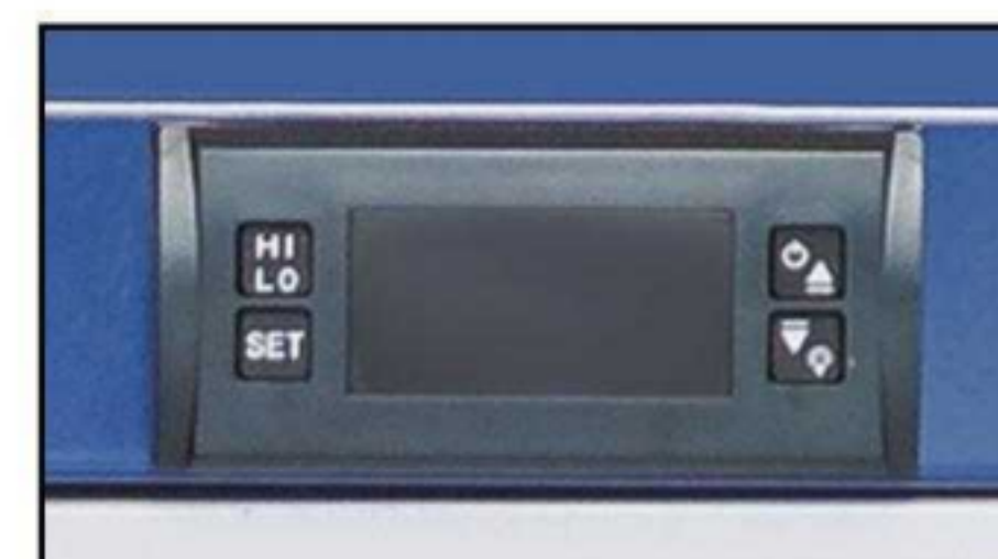
Affichage de la température