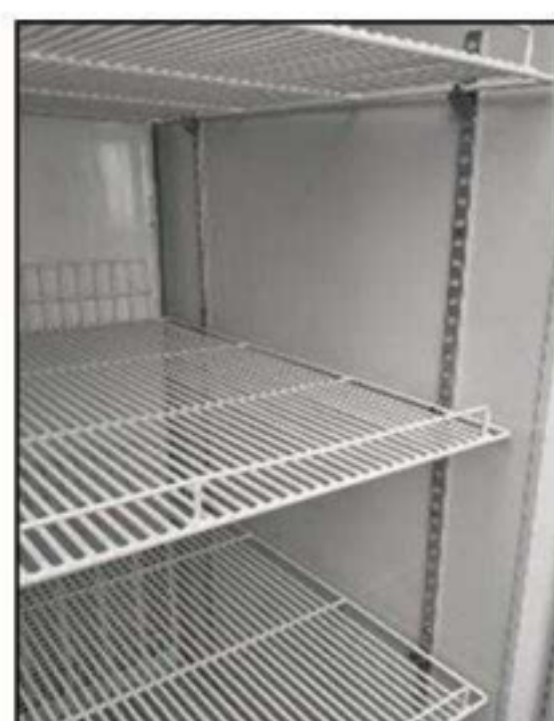
Étagères métalliques réglables